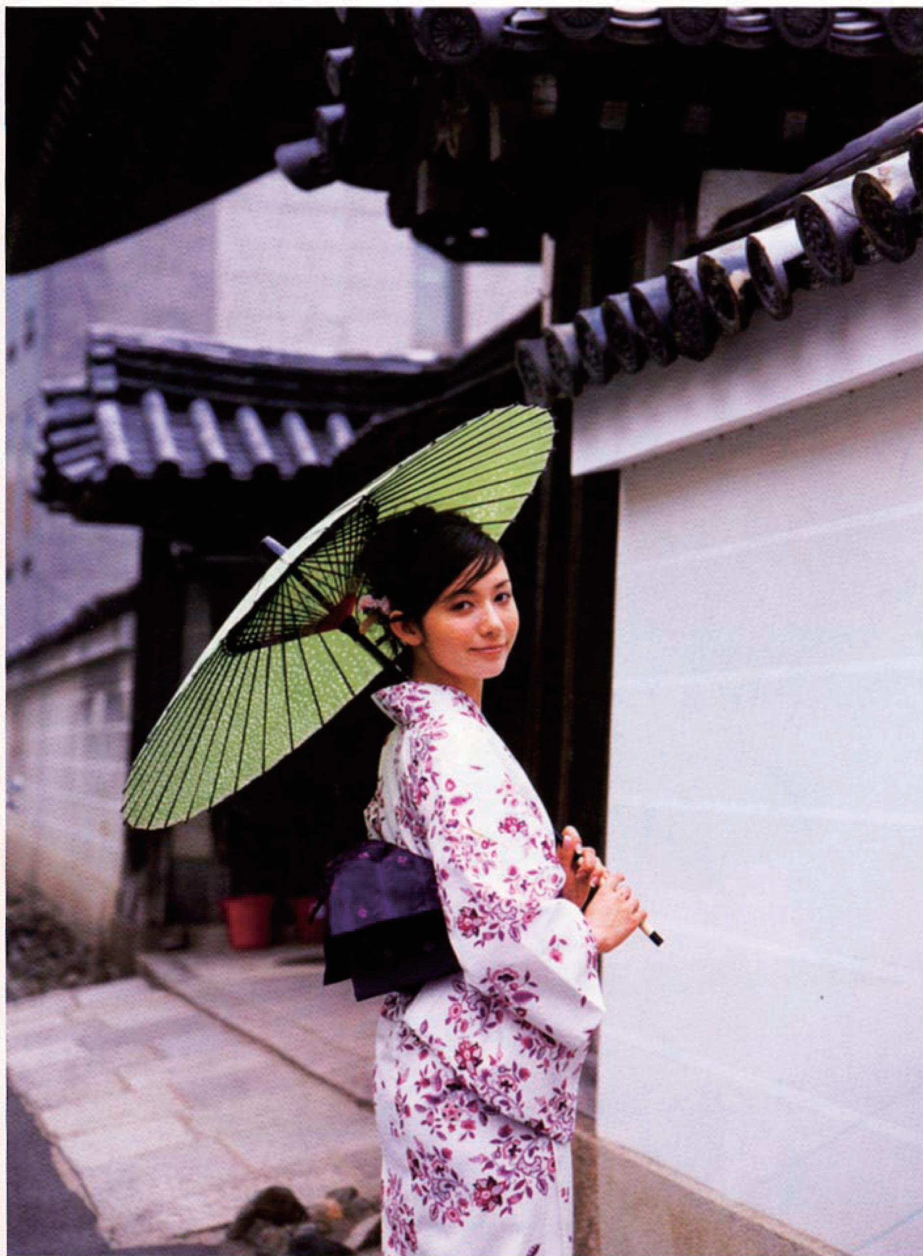
日本舞踊などでも使われる舞傘兼日傘5,250円 白地にピンクの花柄ゆかた29,400円、帯14,490円(共にミントン) / 川島織物セルコン、髪飾り5,250円(装プラス) / 新装大橋・撫松庵