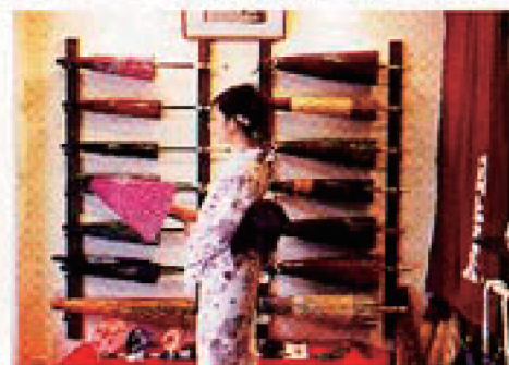
和紙を貼った和日傘は、76cmと82cmの2種類。キッチュなプチサイズがかわいい。