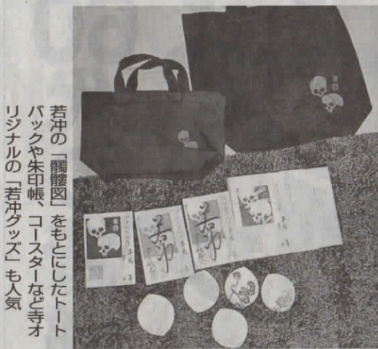
若冲の「鬮圖」をもとにしたトートバックや朱印帳、コースターなど寺オリジナルの「若冲グッズ」も人気