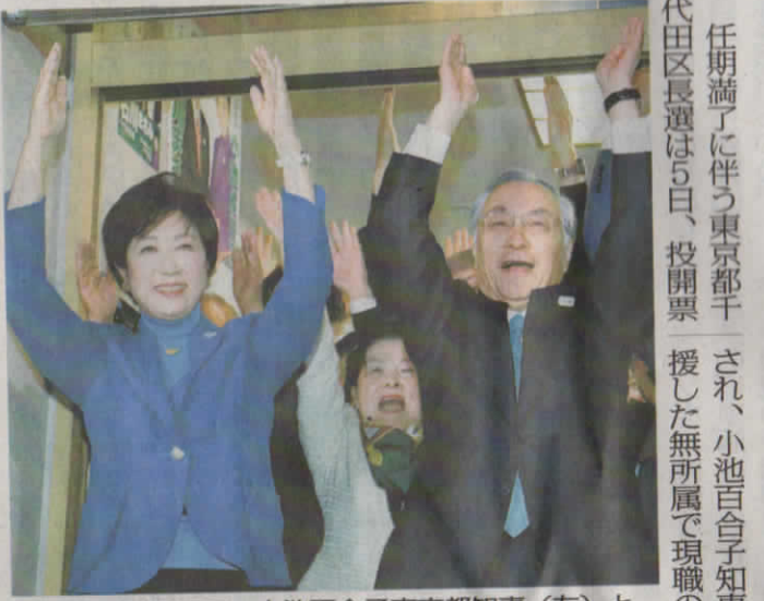
千代田区長選で、小池百合子東京都知事(左)と共に喜ぶ石川雅己氏—東京都千代田区で5日午後8時5分

任期満了に伴う東京都千代田区長選は5日、投票開票され、小池百合子知事が支援した無所属で現職の石川