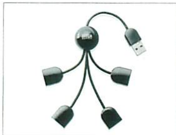
商品デザイン部門 USB2.0ハブ/USB-HUB234シリーズ

横浜発信の楽しい和のデザイン商品をつくりたい、それも今までにないような新しい和の商品をつくりたい、との思いから生まれ