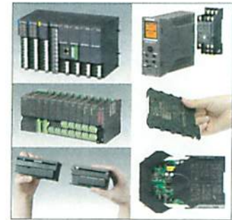
商品デザイン部門 モジュラー型デバイスシリーズ/ リモートI/O R3, R5, R7 信号変換機 M3, M6D, M7E

千年の歴史を持つ和傘の技術を活かし、その竹骨の幾何学構造の美しさや、和紙を透過する光の柔らかさを、モダンリビングの中で活かせるよう照明器具として表現した商品です。傘のように閉じて折畳む事が可能で、流通・保管コストが最小で済みます。また、シェードの色柄をシーンに応じて取り替えて楽しめます。イサムノグチ氏のAKARIシリーズに続く日本のアイデンティティを持つ照明シリーズに発展させたいと思います。