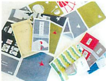
商品デザイン部門 てぬい本/濱文様

この種の業務用設備機器は、表層的な装飾や使用者の趣味性への対応が不要。それ故外見にはデザインされていないと思える物も未だ数多い。単なるスペックアップやコストダウンだけでなく、人が見てどう思うか?と製品への配慮を行う事は、操作性や視認性の点でその製品の質を向上させることになる。機能性・操作性・美観をより高い次元でまとめることを目標に、欧州の製品と競合できるようなデザインを目指した。