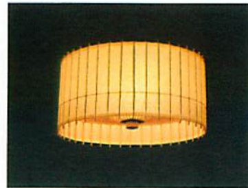
商品デザイン部門 ペンダントライト/和風照明「古都里-KOTORI-」

爪切り本来の機能「切る」に徹底的にこだわり、その存在感をアピールしようと試みました。手に取ったとき手に馴染む自然なカーブで全体をまとめました。また、独自に新開発のシリンドラスプリングの採用で、ワイヤーが外から見えずに故障の心配がありません。