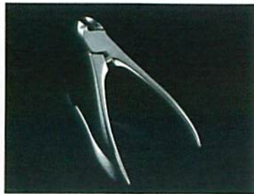
商品デザイン部門 つめ切り/SUWADA

日常使いのタオルをマフラーに初めてデザインしました。今治のやさしい本綿のタオル文化を、日本人特有の繊細な皮膚文化へ落とし込みました。やさしい綿とタオルの風合いをいつもからだでも一番、肌の敏感な首もとで感じてほしい。汗もよく吸い、保温もできます。毎日のお洗濯でも大丈夫です。日常使いのデザインです。