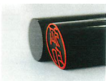
商品デザイン部門 弧印/rod-works

AR : サンワサプライ株式会社 P : サンワサプライ株式会社 企画開発部 課長 末長敬雅 DR : 株式会社GKインダストリアルデザイン 部長 朝倉重徳 D : 株式会社GKインダストリアルデザイン 鈴木 慶、迫坪知広