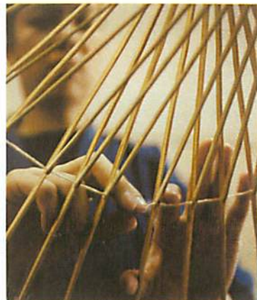
3. 用線聯起竹枝及傘骨，再連接至傘柄，然後固定竹枝之間的距離。