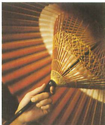
8. 戶外的「野點傘」需要在傘骨之間用線縫緊，傘子愈大針步就愈複雜，近看就像繡花一樣美麗。