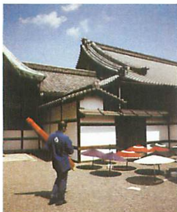
7. 然後放在太陽底下晒乾。這種亮漆只能在太陽照射下乾透，一晒就得晒上一星期。這是在日吉屋旁邊的寶鏡寺，過去一百年無間斷地營業帶出空地的日吉屋把傘晾乾。