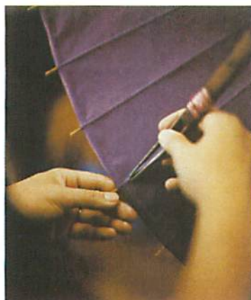
4. 先把工具泡濕，把和紙貼上並裁好形狀後，再用工具粘著每條竹爿邊縫壓實，圖見的工具已經有一百年歷史。