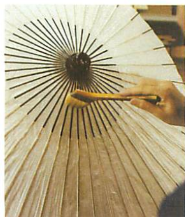
6. 大概一天後就可以在傘面塗上亮漆，防水防蟲。