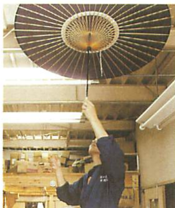
5. 粘好後放在架頂風乾。