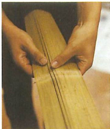
2. 將竹干切成大概1.5毫米粗的竹爿，再將其排成順序，確保和傘形狀自然流暢。