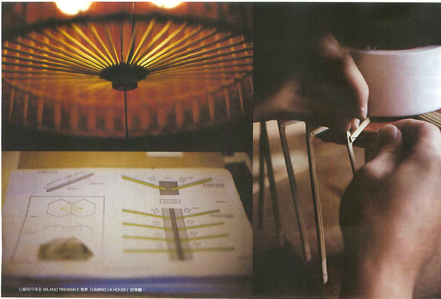
「研吾今年在 MILANO TRIENNALE 發表「UMBRELLA HOUSE」的草圖。

西堀先生帶著「古都里」參與了國內外大大小小的展覽，包括今年在巴黎及法蘭克福舉行的 MAISON & OBJE 2008，去年的米蘭傢具展、東京的 INTERIOR TREND SHOW 等。老外們眼前一亮，連日本人都讚嘆不絕。「古都里」迅速成為京都 BOUTIQUE HOTEL 的新寵，海內外訂單源源不絕，更在去年拿下了日本 GOOD DESIGN AWARD。老和傘，又再從新活了一次。