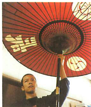
9. 大概三星期至一個月，一把和傘就練成了。由於製作複雜，許多寺院或茶館都不會輕易把和傘棄掉，日吉屋就負責起維修的責任。這把紙番傘專用的野點傘，傘骨與柄已有一百年歷史，屬古物一件。