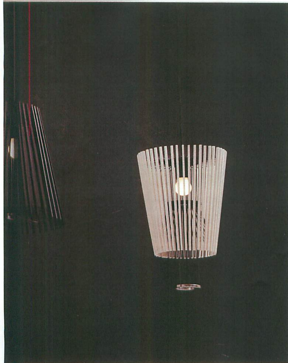
HIYOSHIYA日本品牌日吉屋的吊灯MOTO。本次杂志48页介绍了品牌的故事及灯饰。